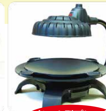
ドーム型プレート 凹面上