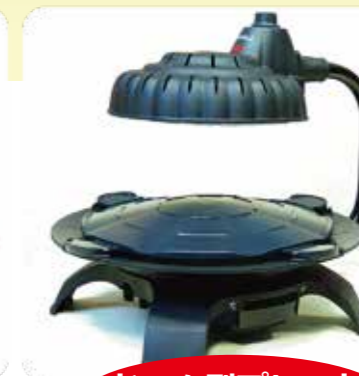
ドーム型プレート 凸面上